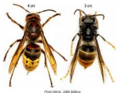
Frelon européen 4 cm Frelon asiatique 3 cm

Au printemps, il est important de rechercher les nids primaires, se trouvant la plupart du temps à max. 2 mètres du sol. En cas de découverte d'un nid (ou de suspicion), il est possible d'annoncer vos observations sur le site www.frelonasiatique.ch , qui regorge également d'informations complètes sur le sujet. N'hésitez pas à vous informer et en cas de besoin, contactez la Municipalité ou la Fédération vaudoise des sociétés d'apiculture. www.apiculture.ch