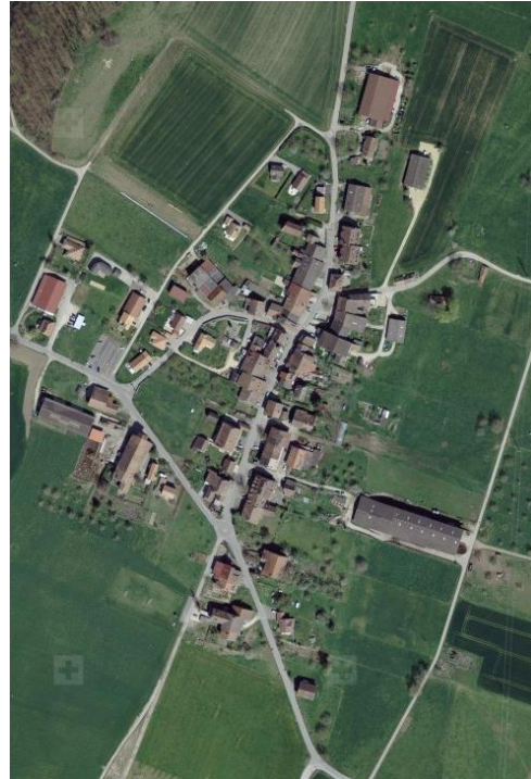
2011 : Constructions dans la partie sud des chemins du Mare et Derrière la Ville