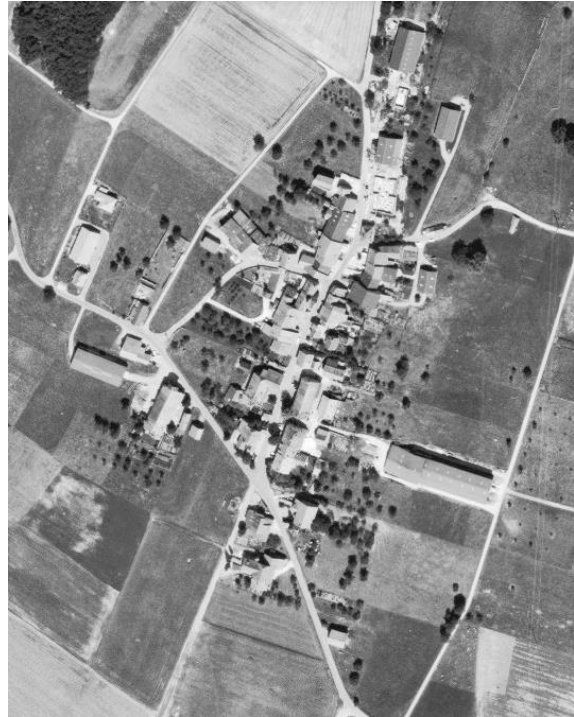
1990 : Création de la zone d'activité