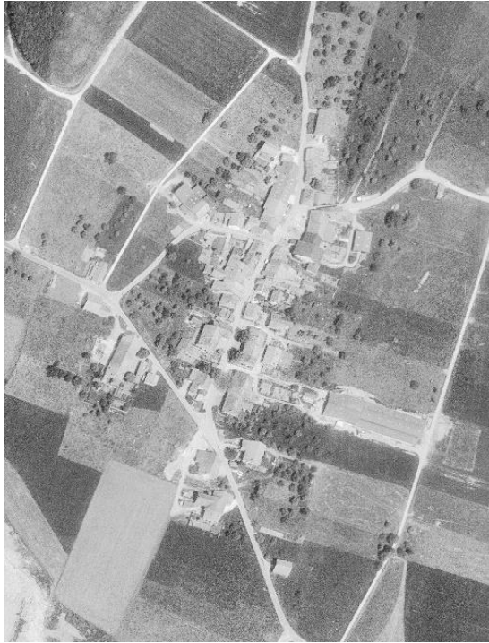
1980 : Village rue