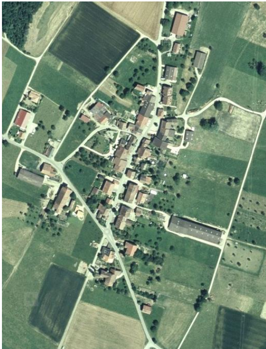
1998 : Peu de modifications par rapport à 1990